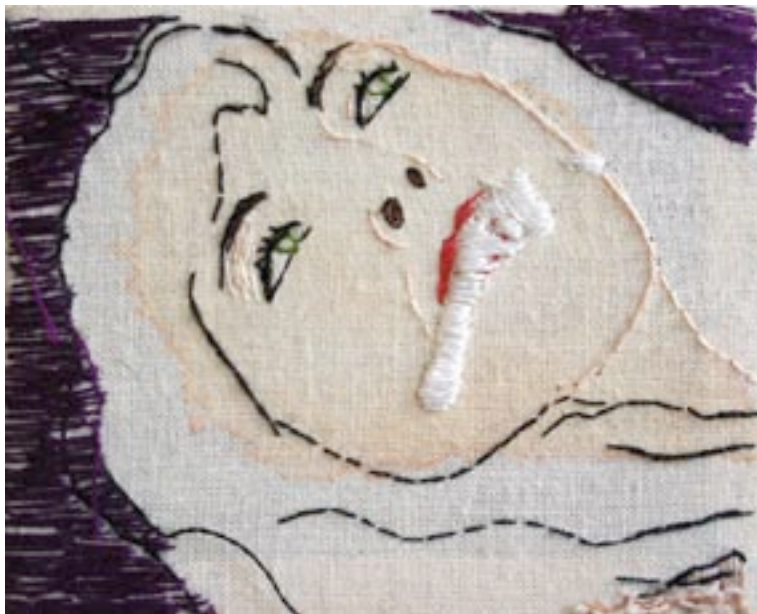
Hinke Schreuders, 'faces 13', 2003, garen en acryl op doek, 7 x 9 x 4 cm