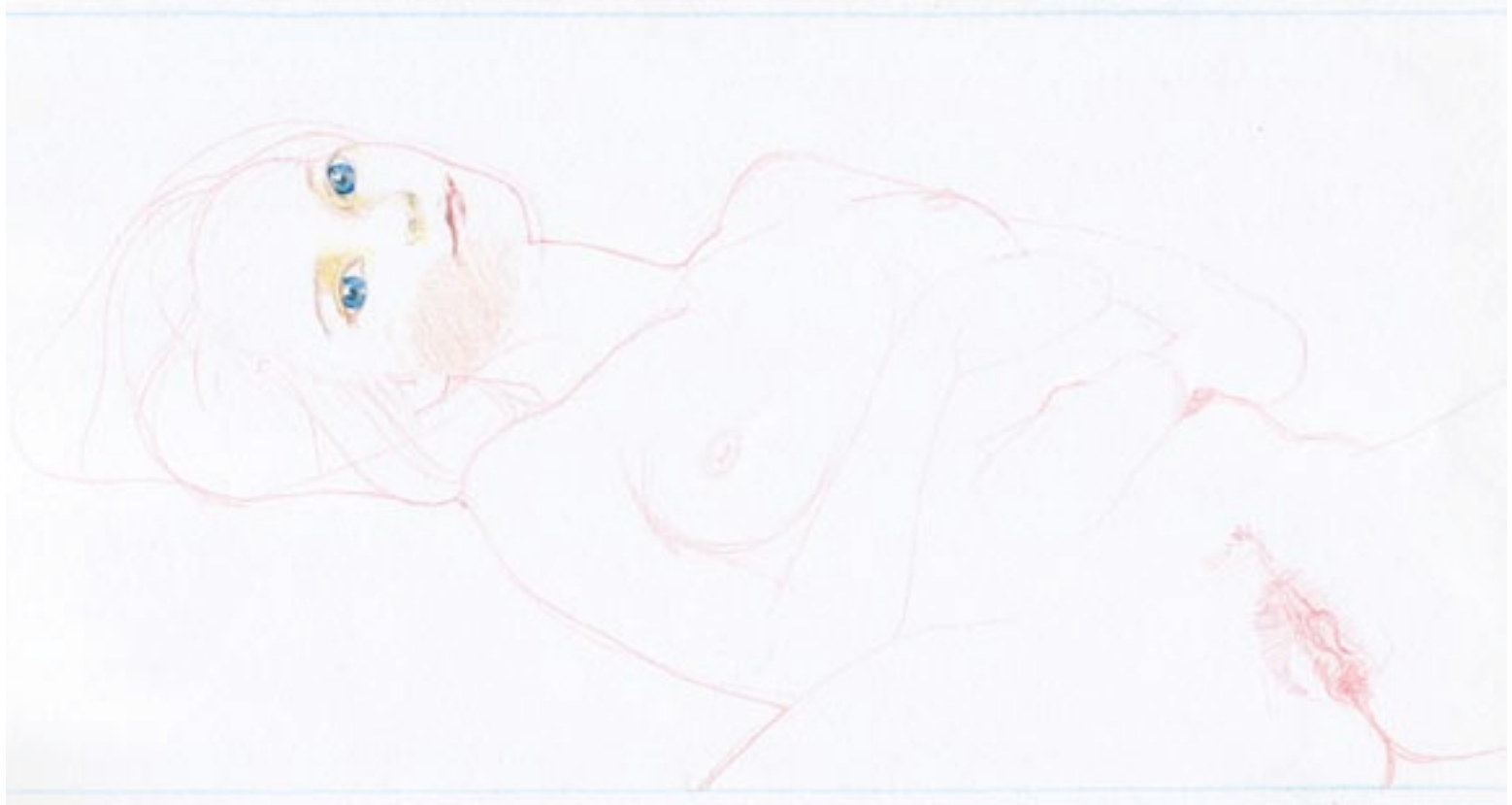
Rosa Boekhorst, tekening in kleurpotlood op papier uit de serie 'display of power', 2006, 21 x 29,6 cm (A4 formaat)

Roos van Put Zijn er verschillen tussen goedkope pornoblaadjes en kunst met een hoog pornografisch gehalte? In de zoektocht naar het erotische of pornografische naakt in het oeuvre van vrouwelijke kunstenaars blijkt dat het gebruik van expliciete seksuele scènes soms door de beschouwer verkeerd worden geïnterpreteerd. Wordt de blik van de toeschouwer gekanteld in deze kunst? Wordt het gewone ongewoon? Of vice versa? Is er een gelaagdheid aanwezig? Wordt hier psychologie van de koude grond bedreven of zien we werkelijk meer dan een opengesperde vagina? Wordt harde seks ingezet als middel om het begerige oog van de toeschouwer te verleiden? Lees, kijk en oordeel zelf. Zes vrouwelijke kunstenaars vertellen over hun werk. Over het waarom van erotiek, seks en porno: Lidy Jacobs (48), Hinke Schreuders (37), Madeleine Berkhemer (34), Esther Janssen (31), Petra van Noort (26) en Rosa Boekhorst (25).